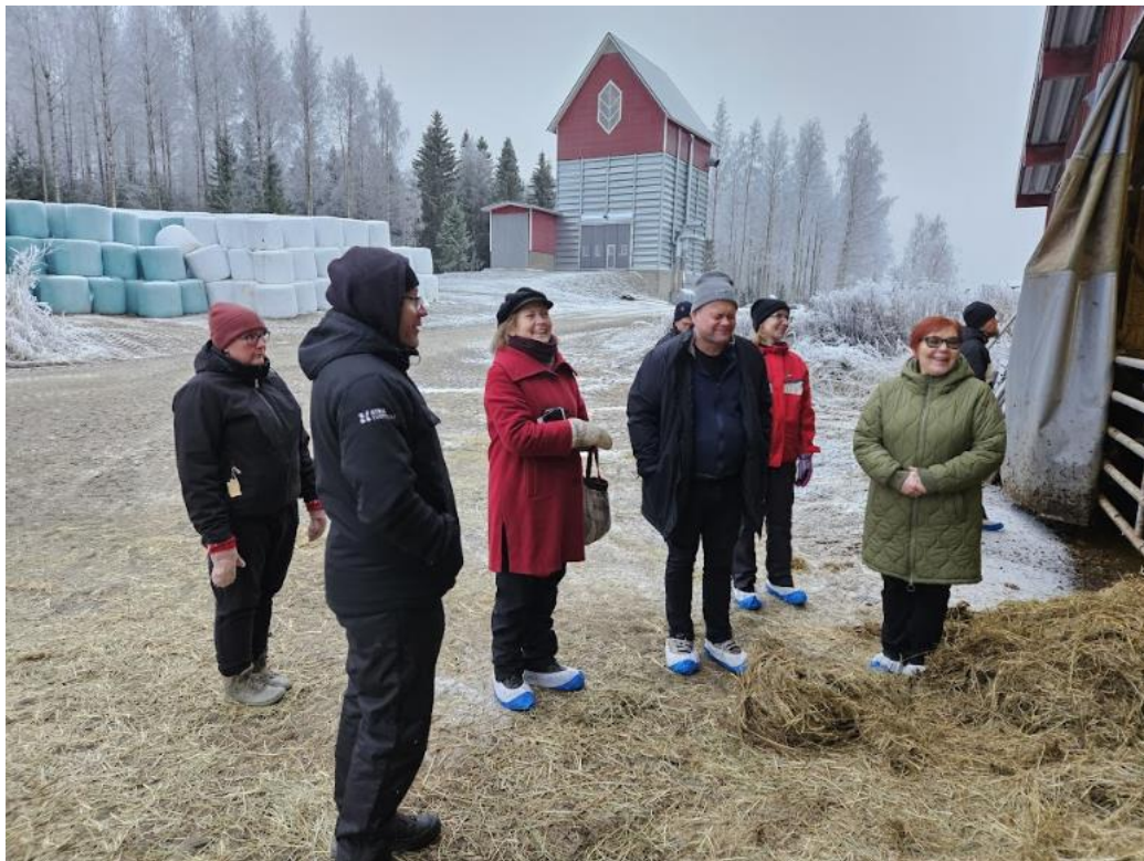
Kuva 7. IKS luomuvaliokunta ja luomuyhdistysten edustajat vieraillemassa Alapihan tilalla.

Luomuyhdistysten ja valiokunnan yhteiskokouksessa aloitettiin kannanoton valmistelu. Parhailaan on käynnissä useampi hanke, joka liittyy Itä- ja Keski-Suomen luomutoimijoihin: Uutta Virtaa Järvi-Suomen luomuun, Luonnon monimuotoisuustuuppaukset ja viljahanke.