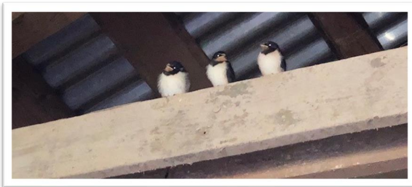
Onnistunut pesintä tuotti haarapääskyn poikueita vuonna 2022