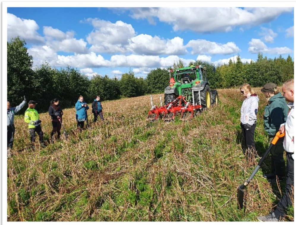
Maaperäpäivässä Viitasaarella tutustuttiin muun muassa jankkurin käyttöön

Hiililaskurit maataloudessa, marraskuu 2022